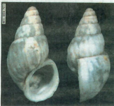
Пуж Travunijana djokovici

Нова шкољка Travunijana djokovici је откривена у Бандићким изворима, којима припадају и Мареза и Бандићко око, а