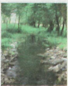
Бријеско врело у селу Бандићи, удје је пронађена нова врста пужа

Јединственој врсти пужа дали смо име у част Новака Ђоковића, јер су нас мотивисали ентузијазам и енергија којим први рекет свијета плијени. Ријеч је о једној од најређих врста можда и на свјетском нивоу, тако да је дефинитивно јединствен. Сада радимо на великом пројекту који ће укључити и професоре и докторанде из Црне Горе, Србије, Пољске и Словачке, како бисмо урадили